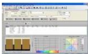
Color iMatch Basic

Instrument do kontroli jakości Uniwersalny instrument do stałych pomiarów różnego rodzaju próbek ze względu na materiał, rozmiar, kształt, teksturę i stopień przezroczystości. Równoczesny pomiar koloru i wyglądu zapewnia dokładność. Wbudowany system NetProfiler3 zapewnia spójność i precyzję użytkowania.